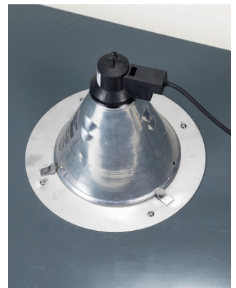
Auf den Lampenkranz können 150 Watt und 250 Watt Lampen befestigt werden.

Für weitere Informationen sprechen Sie uns gerne an! Tel. 02388 3071-190