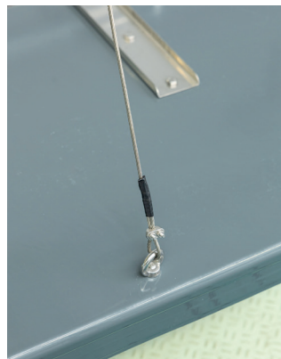
Die Montage der Aufhängung muss vor Ort erfolgen.