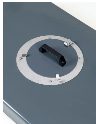
Der Stalleinrichter kann bei Bedarf einen Lampenkranz mit Verschlussdeckel montieren.